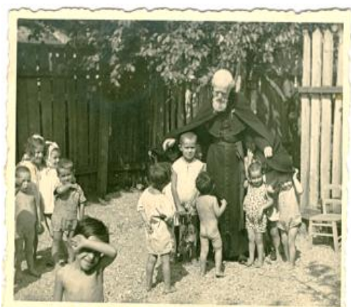
Bucarest, 1943, visite d'un orphelinat.