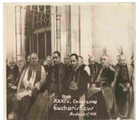
Mgr Ghika au Congrès Eucharistique de Budapest en 1938